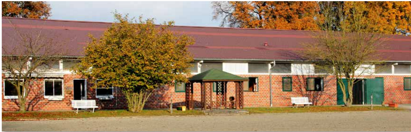
The main stable, located under the same roof with the large indoor riding arena and right next to the all-weather outdoor arena. Der Hauptstall, unter einem Dach mit der großen Reithalle und direkt neben dem Allwetter-Aussenreitplatz gelegen.