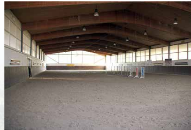
The indoor riding arena (25x65 m) with watering system Die Reithalle (25x65 m) mit Bewässerungssystem