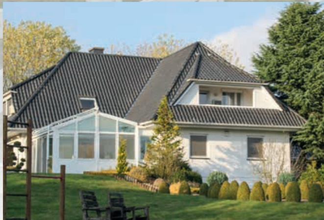
Bright, spacious house with winter garden Helles, großzügiges Wohnhaus mit Wintergarten