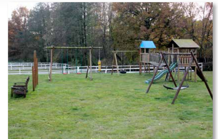
A lot of space for children to play Viel Platz für Kinder zum Spielen