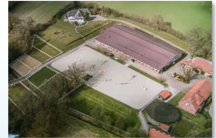
Overview of the entire property Übersicht der gesamten Immobilie