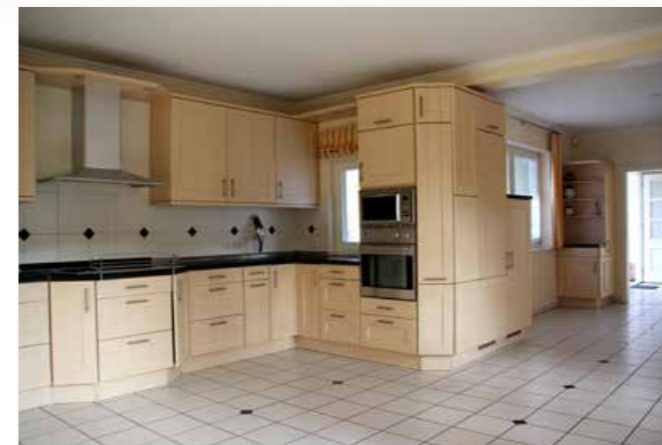
The kitchen/living-room is flooded with natural light Die lichtdurchflutete Wohnküche