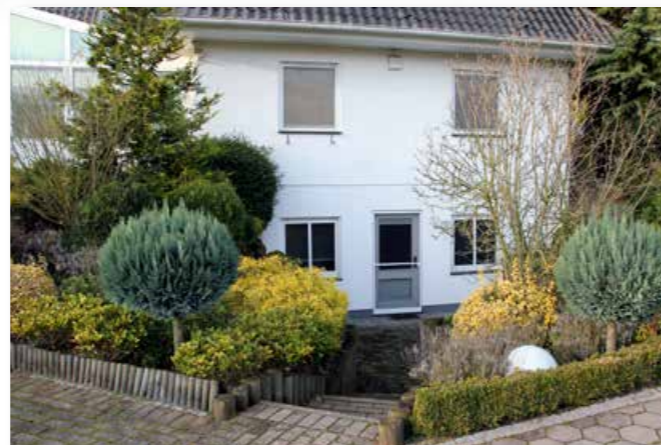
Separate guest apartment Separate Gastewohnung