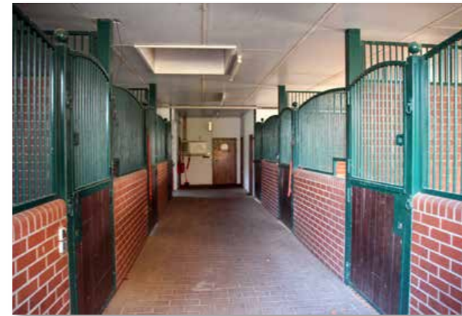
One of the three functional designed stables Einer von den drei zweckmäßig gestalteten Ställen