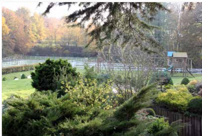
View over the low-maintenance garden to the paddocks Blick über den pflegeleichten Garten auf die Paddocks