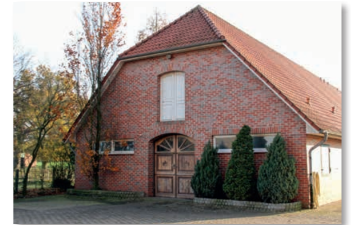
Employee-/guest house (4 apartments plus stables) Mitarbeiter-/Gästehaus (4 Wohnungen plus Stall)