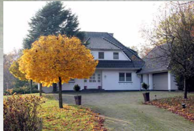
Driveway to the residential house, on the right large garages Auffahrt zum Wohnhaus, rechts große Garagen