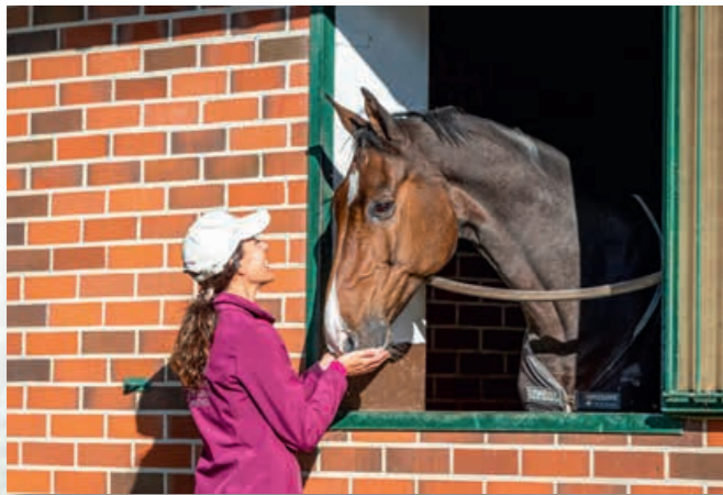
All boxes are equipped with a window. Alle Boxen sind mit einem Fenster ausgestattet.