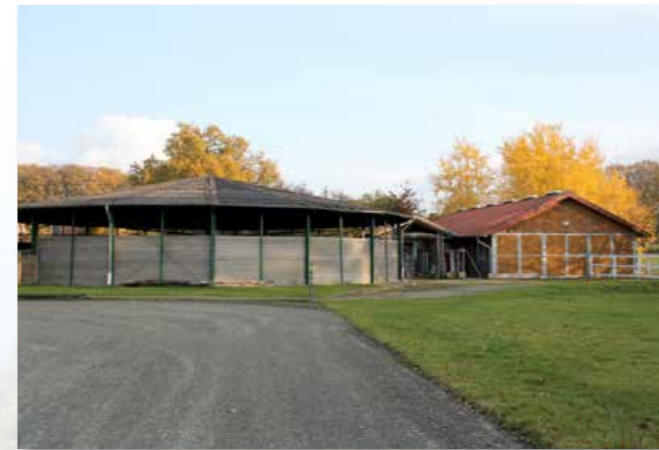
The covered horse walker, next to it another stable section Die überdachte Führanlage, daneben ein weiterer Stalltrakt