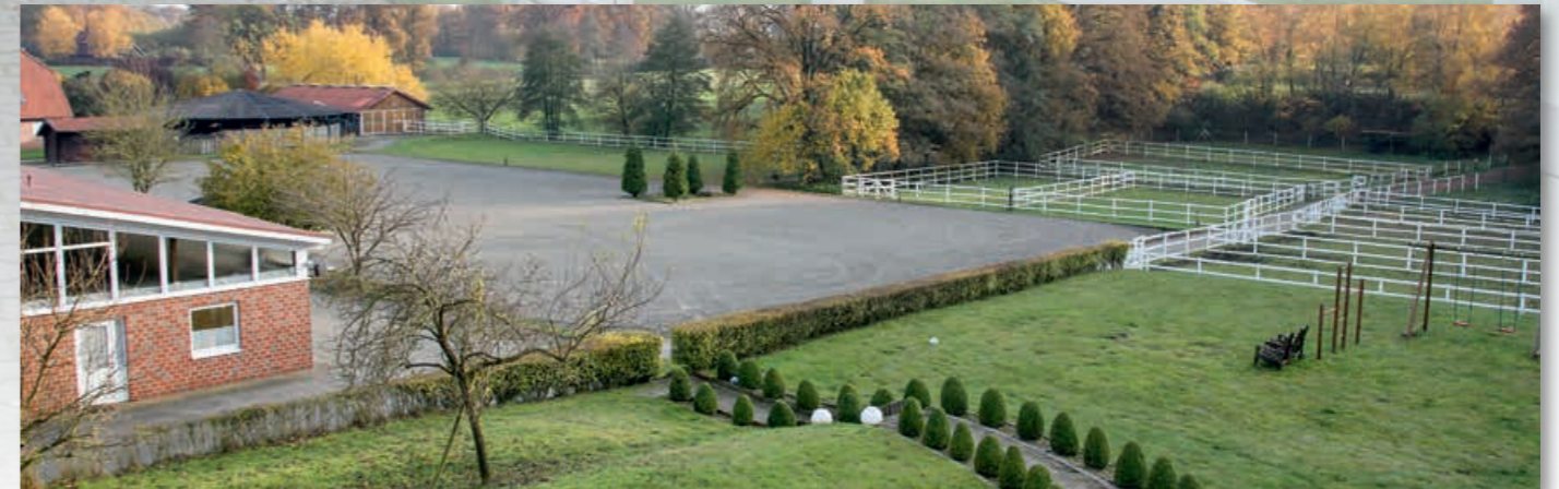
The residential house is situated higher with a fantastic panoramic view and offers a direct path from the terrace to the riding arena. Das Wohnhaus ist höher gelegen mit einem fantastischen Rundumblick und bietet einen direkten Verbindungsweg von der Terrasse zum Reitplatz.